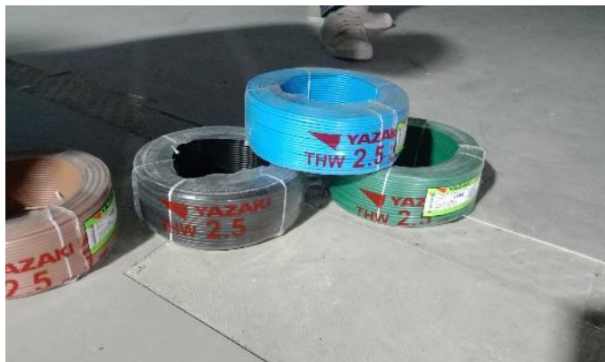
งานร้อยสาย แสงสว่าง + ปลั๊กไฟ