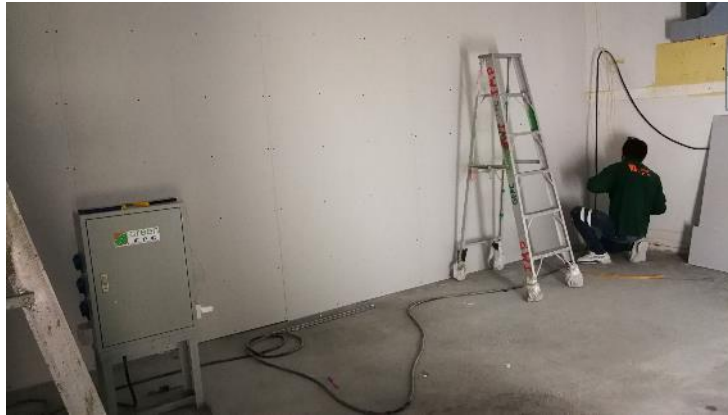
งานติดตั้งโครงผนังเบา